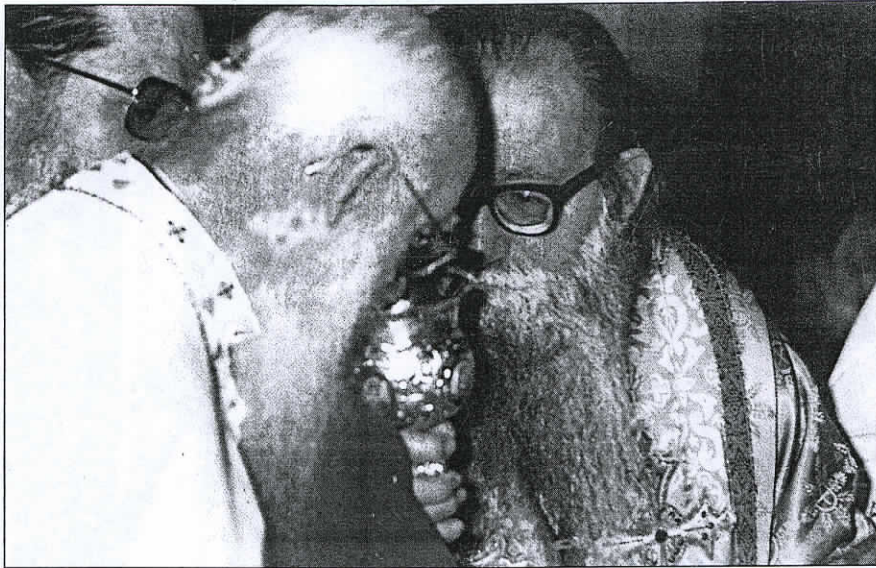
Με τον Μητροπολίτη κ. Αυγουστίνο Καντιώτη

Στο μεγάλο αυτό έργο είχε την πολύτιμη επκοουρία και την αθόρυβη συμπαράσταση της ευγενικής και